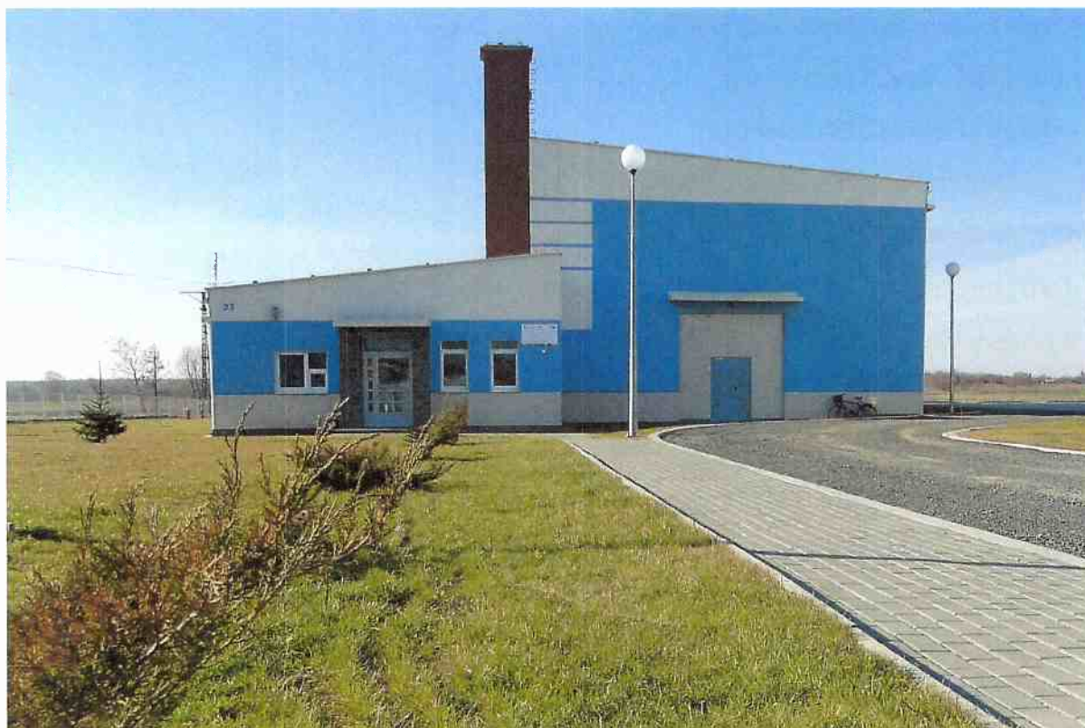
Stacja Uzdatniania Wody