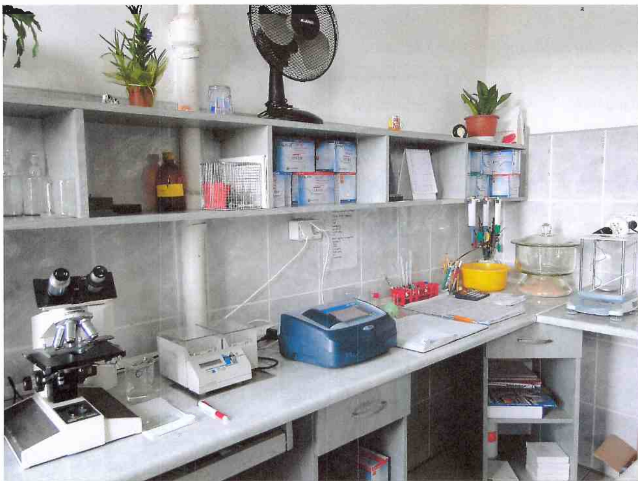
Laboratorium na Oczyszczalni Ścieków